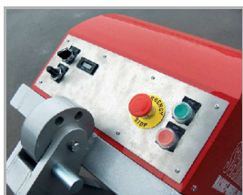
ovládací panel SC 650