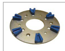
disk se Snap-On brusnými segmenty