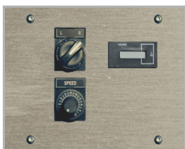
regulace směru a velikosti otáček 500-1100 ot./min