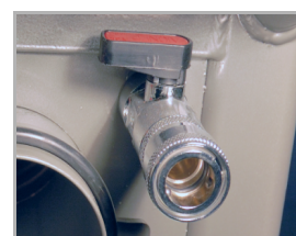
přívod vody s kohoutem dává možnost broušení za mokra