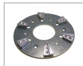
disk se Snap-On segmenty na hrubé odstraňování

robustní brusná hlava s nuceným oběhem brusných disků