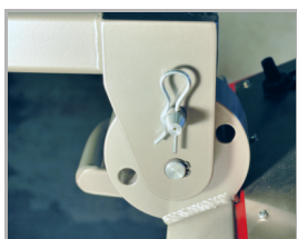
fixace ovládací rukojeti ve více polohách