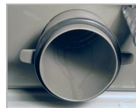
možnost broušení za sucha s odsáváním hadicí Ø 75 mm

broušení za sucha s odsáváním nebo za mokra s přívodem vody