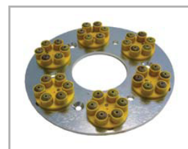
disk se Snap-On leštícími segmenty