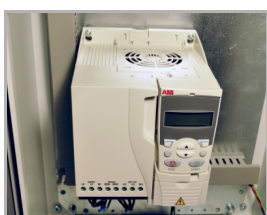
frekvenční měnič s ochranami a pomalým rozběhem motoru